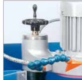
Höhenverstellung / vertical adjustment