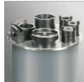
Trumpf oder Amada Matrizenaufnahmen Trumpf or Amada die holders