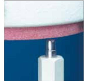
Abrichte Diamant / true diamond