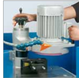
einfache Handhabung / userfriendly handling