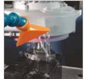
Wasserkühlung / water cooling